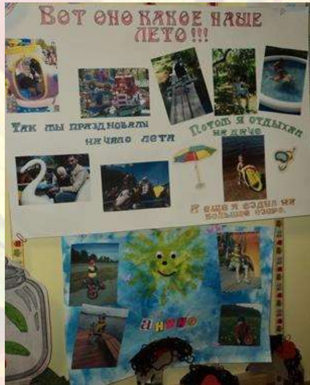
Фото выставка «Вот оно какое наше лето!»