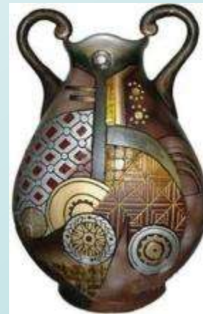
Предметы из глины