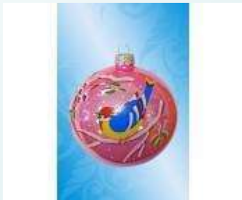
Предметы из стекла